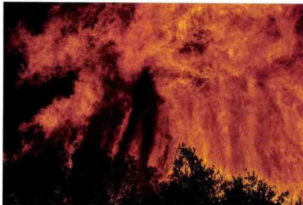
Francesca Piqueras, Feu 8 , tirage LighJet, 80 x 120 cm.

S econd volet d'un projet artistique sur les éléments fondamentaux entamé en 2018, Feu est, comme toute les séries de Francesca Piqueras, un travail avant tout métaphorique sur le rapport de l'homme à la nature. Après la pierre et l'eau de Movimento, la photographe nous plonge maintenant au cœur d'un brasier qui n'est autre que celui de l'âme humaine. Avec Feu, l'artiste pousse plus loin son questionnement sur notre rapport à la nature, en pointant son objectif sur un élément dont la domestication par nos ancêtres, il y a un million d'années, signe l'origine d'un destin en rupture avec les autres espèces. Âge de bronze, âge de fer, révolution industrielle, les grands tournants de l'histoire humaine sont marqués par l'utilisation du feu pour forger des objets et des armes, pour fabriquer et animer des machines.