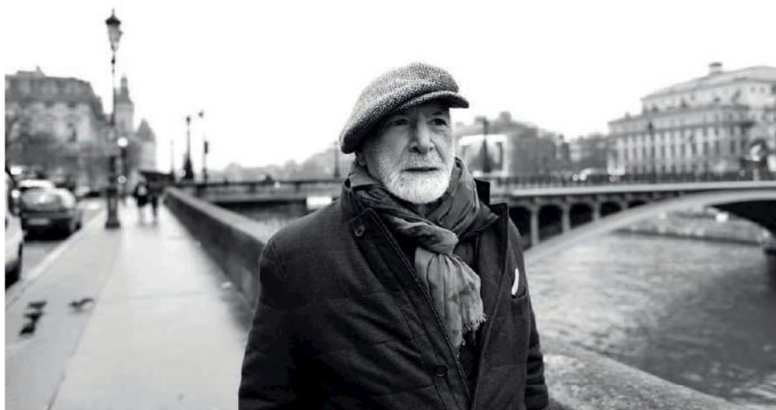
Mehmet Gülerüz