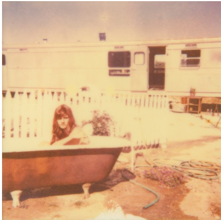
The Girl III, 2011

« La Californie est le lieu où je peux poursuivre mes rêves et me libérer des normes. Ma propre identité change. Je tente de capturer ce sentiment. »