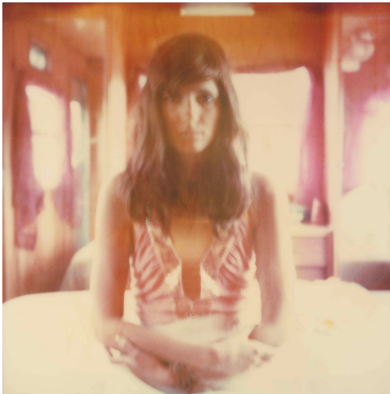
Sans titre, 2013

Chacune des photographies exposées fait partie intégrante du film et est traversée par son histoire.