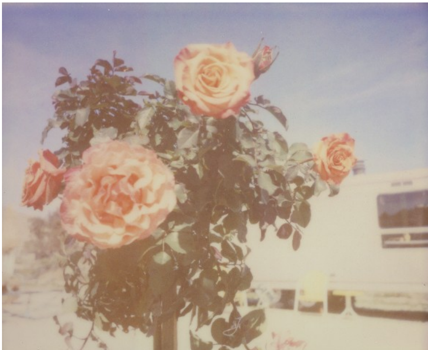
Sans titre 2013 (roses)