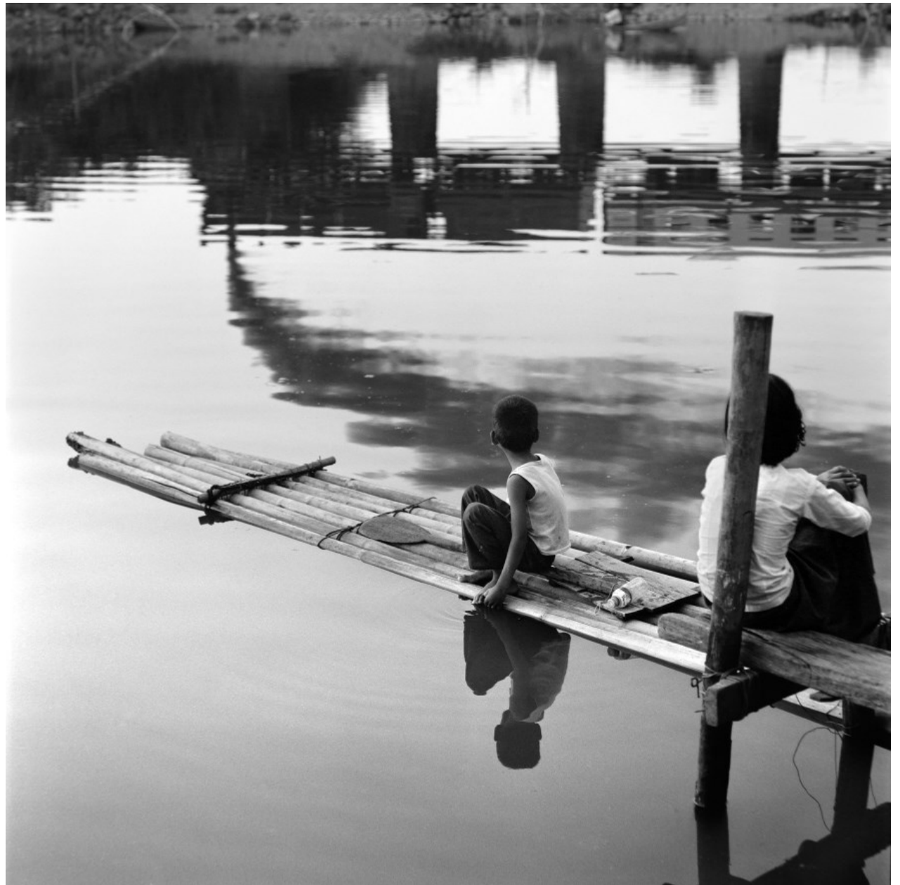
Sunset near Kali – Bago Region, Myanmar, December 2019.

Puriste, Pietro Pietromarchi ne travaille qu'en argentique, avec un appareil photo dont tous les réglages doivent être effectués manuellement : « Pour lui, écrit Bénédicte Philippe, ce mode manuel, comme celui du développement artisanal des tirages, colle, au plus près de l'âme de l'âge d'or de la vapeur : la quête par l'effort, l'acharnement. Une certaine vision romantique du dépassement. Qu'il s'agisse d'attendre des heures l'évanouissement d'un bouquet de nuages, une pluie d'étincelles au cœur de la nuit. Et le miracle se produit. Souvent. Sans recadrage au final ni retouche. En dépit