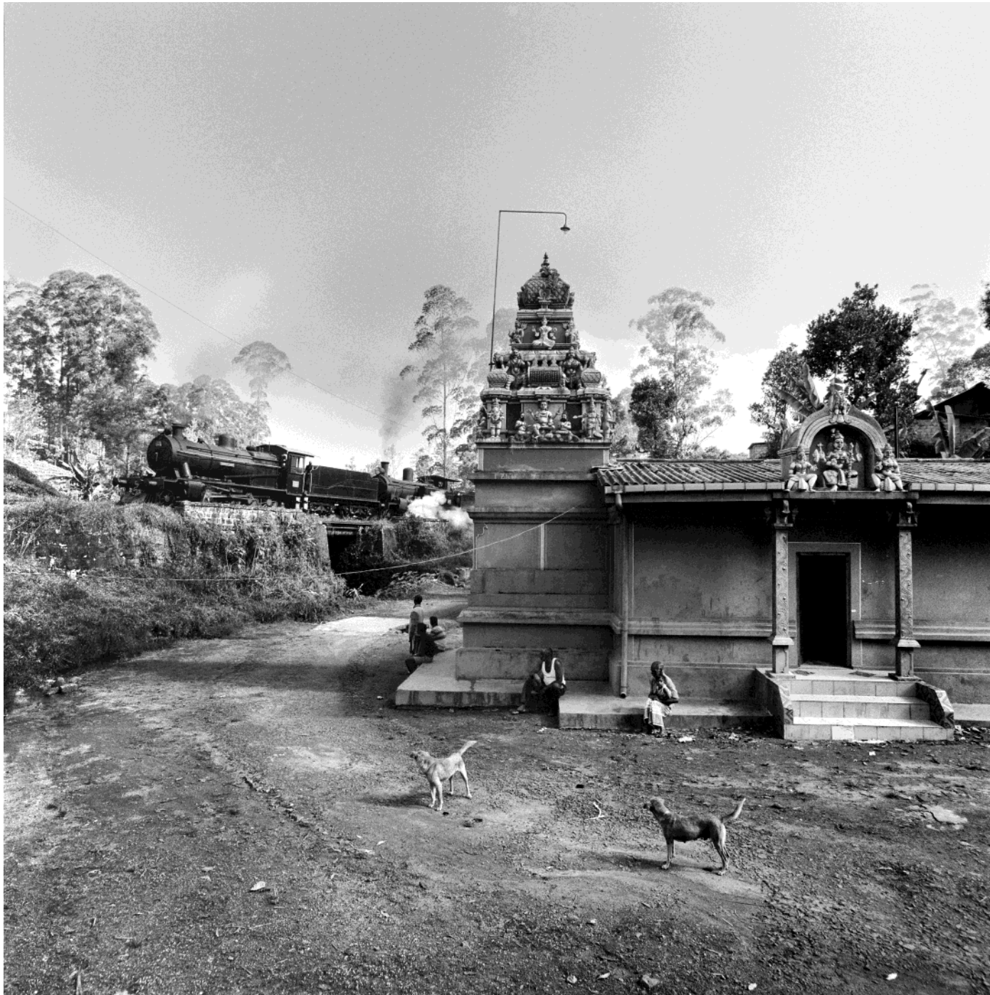
Pathana Hindu Temple. Central Province, Sri Lanka, February 2018