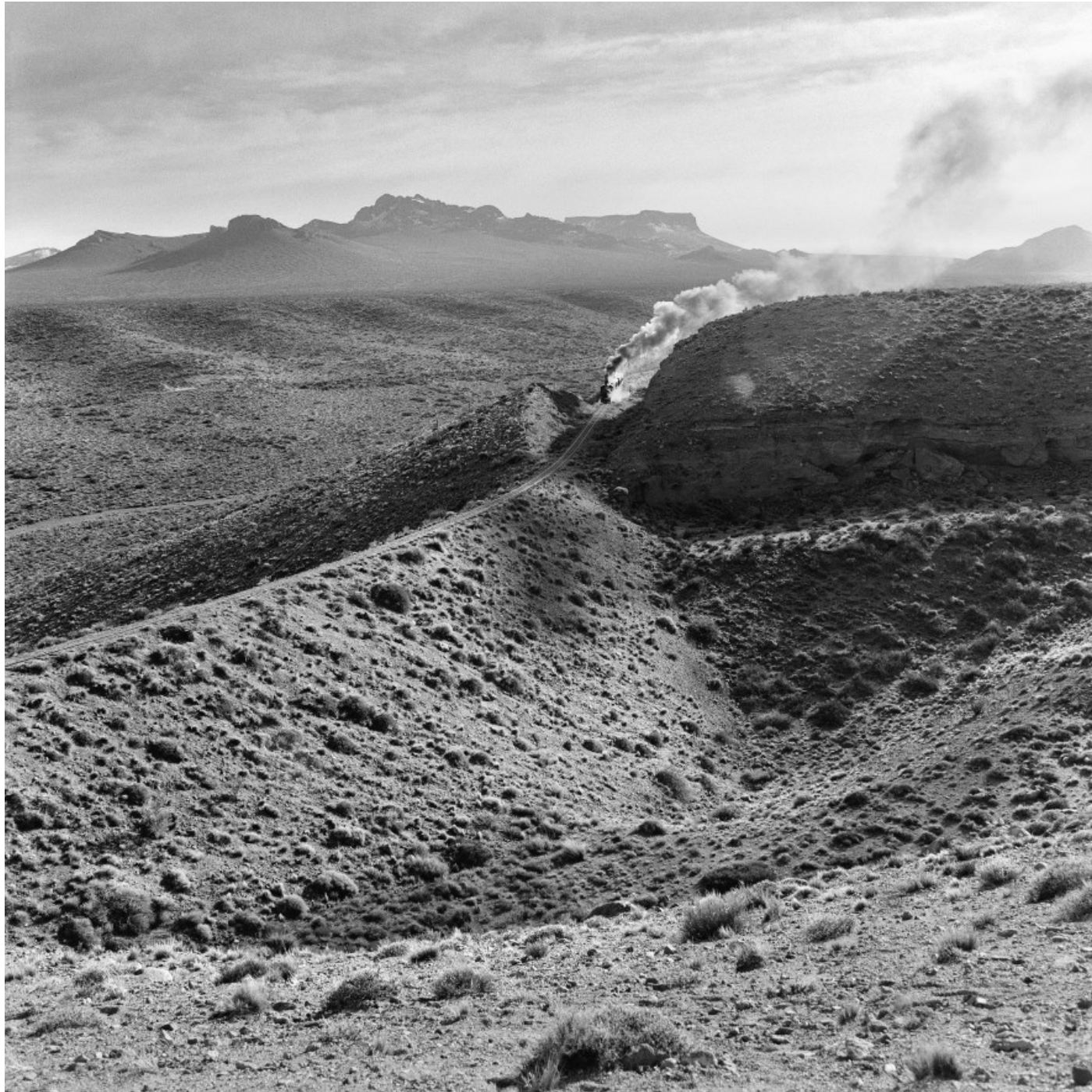
Into the Wild. Rio Negro Province, Patagonia, August 2019.