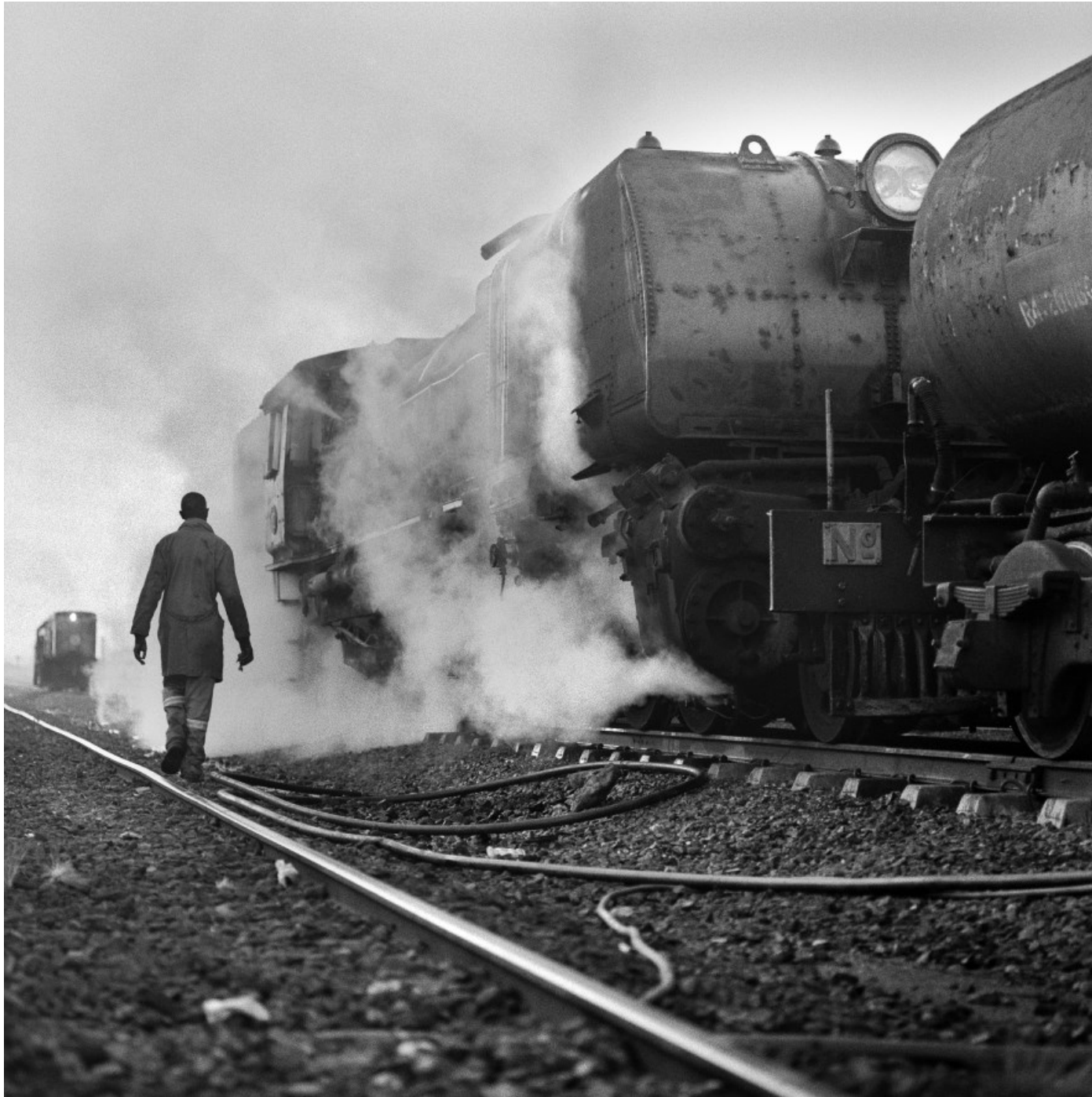
Maintenance – Thomson Junction, Zimbabwe, July 2017.