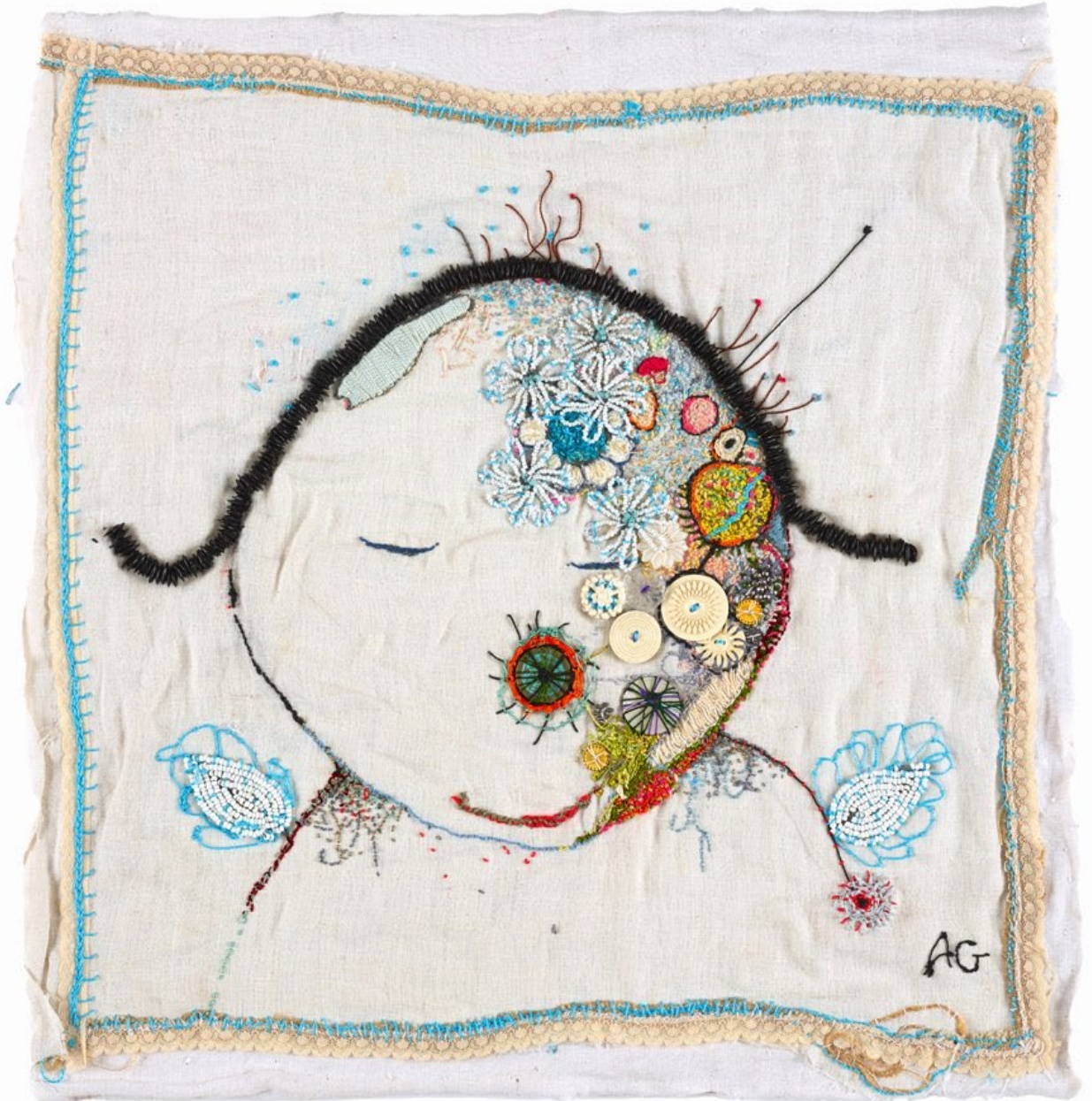
Fille heureuse d'Anouk Grinberg, exposée à la galerie GNG.

"Je suis une éponge : ce qui arrive aux autres m'arrive par de drôles de biais. Je peins souvent les gens, pas la façade, mais le dedans." Anouk Grinberg