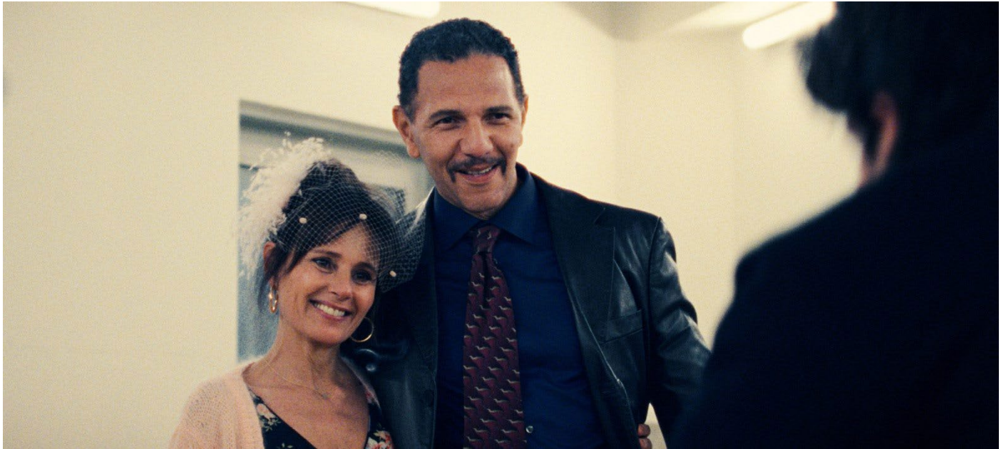
Anouk Grinberg et Roschdy Zem dans L'Innocent (2022) © Les Films des Tournelles. Anouk