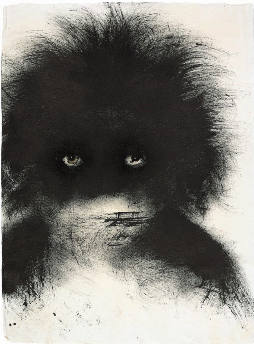
Enfant hirsute d'Anouk Grinberg, exposé à la galerie GNG.