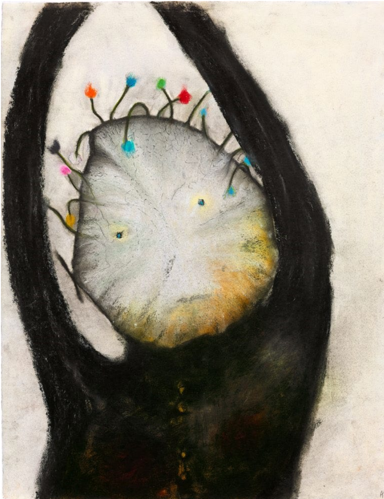
La fille qui danse d'Anouk Grinberg, exposée à la galerie GNG.