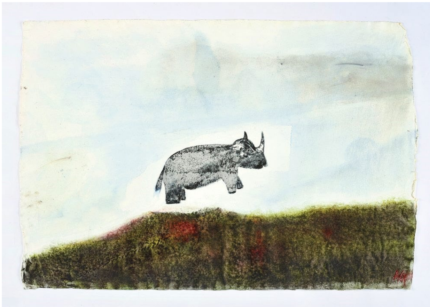
Rhinocéros volant d'Anouk Grinberg, exposé à la galerie GNG.