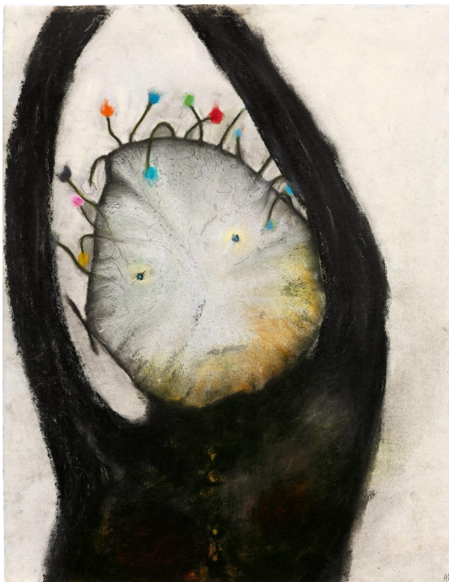
La fille qui danse, pastel

comme si tu étais une trompette et que le monde jouait à travers toi. " Dans un entretien accordé au journal Le Monde en 2021, Anouk Grinberg décrivait les spécificités de son travail d'actrice. Jouer un rôle et se laisser porter par lui, en fusionnant avec l'univers pour en devenir sa voix... Cette conception du jeu d'acteur n'est pas sans rappeler sa production de plasticienne, animée par la même démarche : celle de se laisser porter par ce qui relève d'une exploration de l'indicible et du jaillissement intuitif de ses pensées. L'artiste travaille sans croquis préalables, donnant une grande importance à l'instinct brut, qui constitue la grande part de son inspiration.