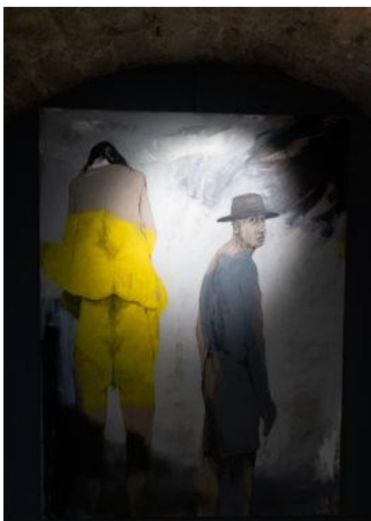
sans titre

La Galerie de Prestige Gilles Naudin (GNG) est une référence incontournable dans le domaine de l'art contemporain. Fondée en 1995, elle s'est rapidement distinguée par sa sélection éclectique d'artistes contemporains de diverses nationalités, reflétant ainsi la diversité culturelle et esthétique de l'art actuel. Bien que privilégiant la figuration, la galerie reste ouverte à d'autres formes d'art, telles que l'abstraction, la sculpture et la photographie. Elle est aujourd'hui un véritable havre de paix pour les passionnés d'art contemporain, qui y découvrent des talents exceptionnels venus des quatre coins du monde.