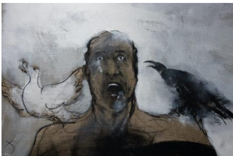
sans titre

La galerie GNG offre ainsi au public français une rare opportunité de découvrir l'œuvre fascinante de Bahram Hajou. La subtile harmonisation des teintes tantôt apaisantes tantôt vibrantes dans les compositions de l'artiste s'accompagne d'un jeu magistral sur les regards expressifs de ses personnages nus, révélant ainsi les profondeurs de l'âme humaine, où l'insécurité et l'inquiétude se côtoient. Il utilise une technique abstraite de couleurs, de sable et de pigments, avant d'ajouter des personnages au fusain, généralement sans décor, pour mieux toucher la corde sensible de l'humanité la plus simple et la plus poignante en chacun de nous. Les thèmes qu'il explore sont profonds et universels, tels que la solitude, la finitude, la violence, la sexualité et les relations. L'œuvre de Bahram Hajou fait plonger dans un univers émotionnel captivant, dans lequel le spectateur est amené à se questionner sur sa propre humanité. Sa technique unique et sa vision artistique singulière confèrent à ses toiles une profondeur et une intensité qui ne peuvent laisser personne indifférent.