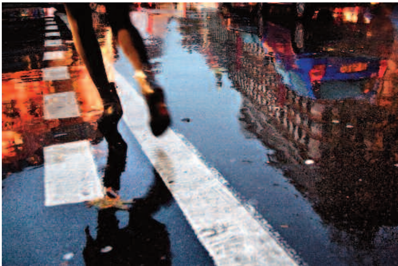
MIROIR La Parisienne aime franchir la ligne blanche, mais toujours avec coquetterie. Et la ville, narcissique, se mire à chaque averse.