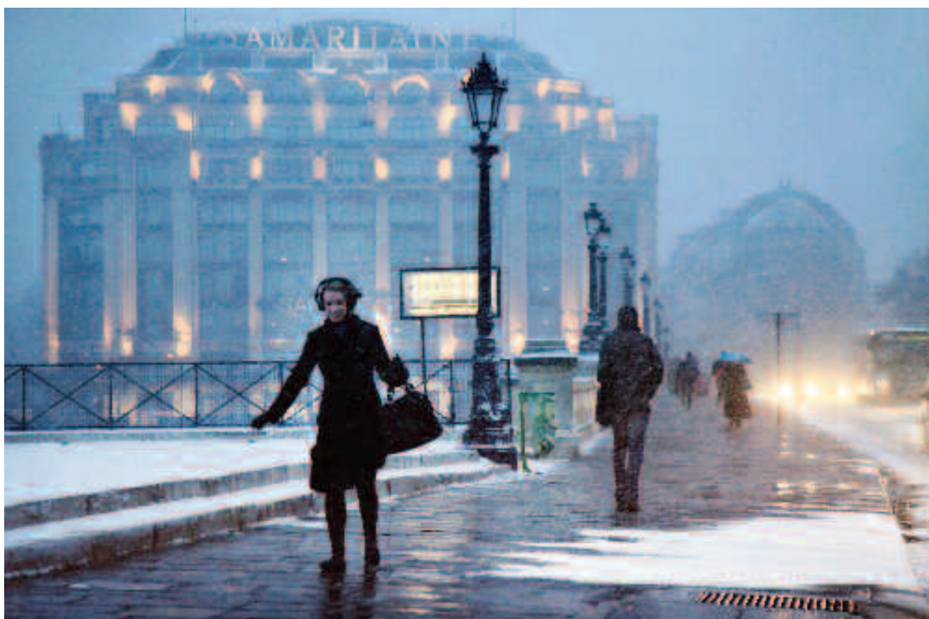
PATINOIRE La Samaritaine en connaît un rayon en intempéries. Paris, depuis mille ans, avance en terrain glissant. Fluctuat nec mergitur.