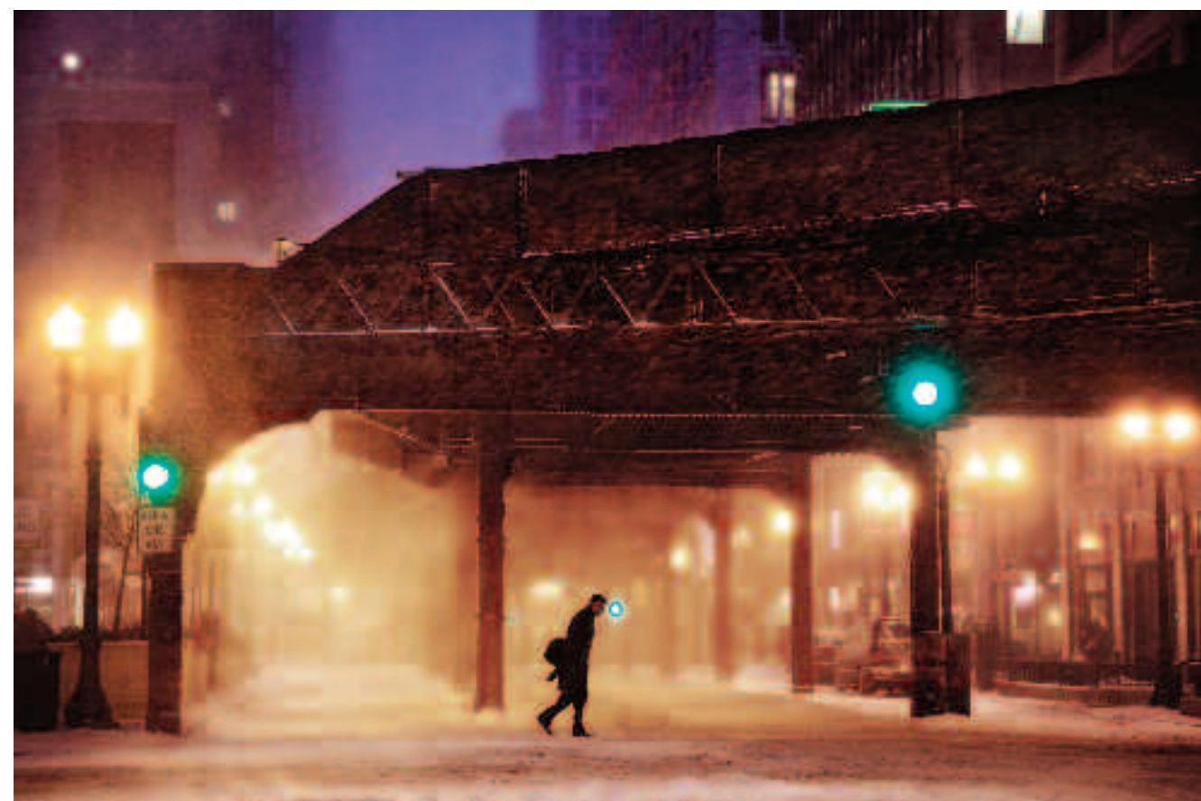
METROPOLIS Chicago, la ville où il coule de la neige sous les ponts, et des métros dans la nuit. La tête du piéton harassé, tel un lampadaire éteint...