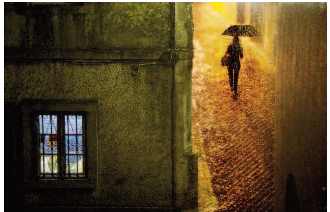
ABRIS A Lisbonne, les jambes des femmes se jouent des pavés ronds, et l'écho de leurs pas fait trembler la lumière jusque dans les cuisines.