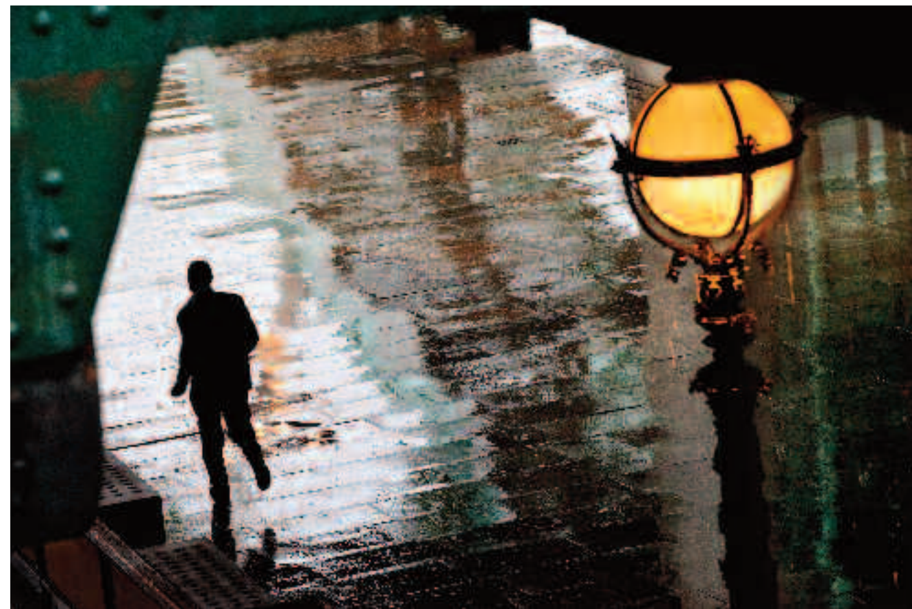
FOULÉE A Londres, il faut courir pour tenir le haut du pavé. Ici, la pluie est comme chez elle, et le ciel tamise la lumière quand elle n'est pas électrique.