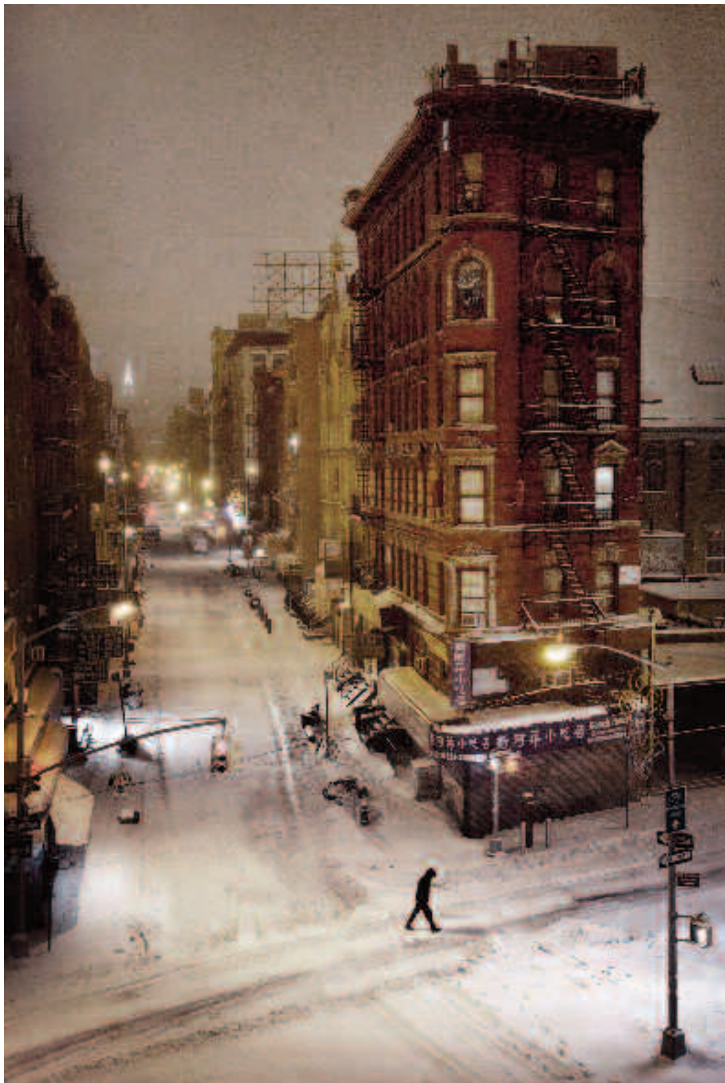
COSMOPOLITE Les enseignes de Chinatown, à New York, semblent frappées de flocons, et le piéton est comme calligraphié. Neige d'Amérique, encre de Chine.