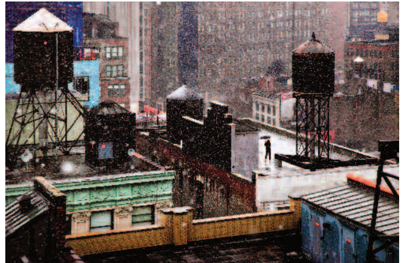
RÉSERVOIRS Chapeaux des citernes, triangle du parapluie : retenir l'eau, tout en haut. Malgré ce verglas new-yorkais, qui est donc sur le toit ? Toi ?